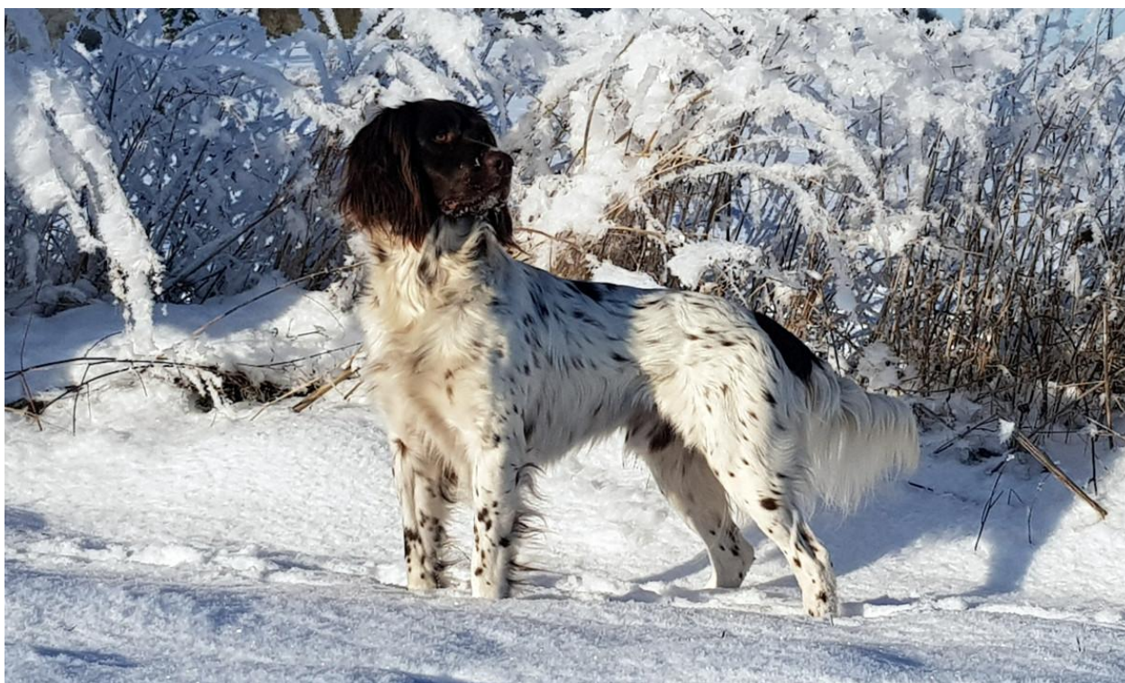
Elliot vom Apfelgarten